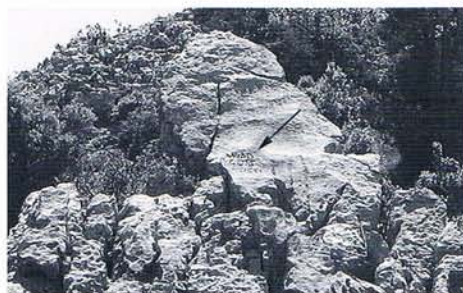
5 Emplacement de l'inscription n° 2 sur le rocher.

Cette inscription ne correspond à aucune des quatre signalées par Mouterde dans la même région, « entre Michmich et Ouadi Mihal » (Breton, 1980), et qui n'ont jamais été revues depuis.