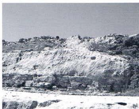
2 Vue générale du rocher.