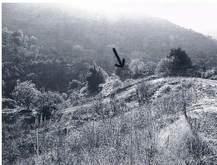
7 Vue générale de l'emplacement de l'inscription de Baskinta, en contrebas d'une piste.