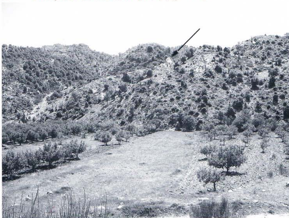
4 Vue générale de l'emplacement du rocher de l'inscription de Michmich au-dessus d'un verger.