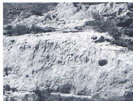
3 Détail de l'inscription de jabal Sehta.