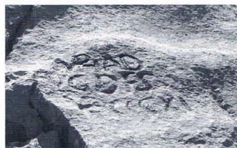
6 Détail de l'inscription n° 2.