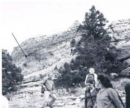
12 Détail de l'inscription n° 4.